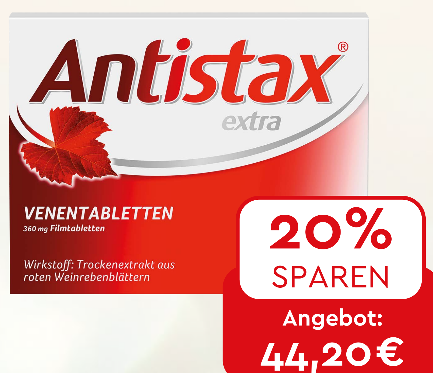
Antistax extra VENENTABLETTEN