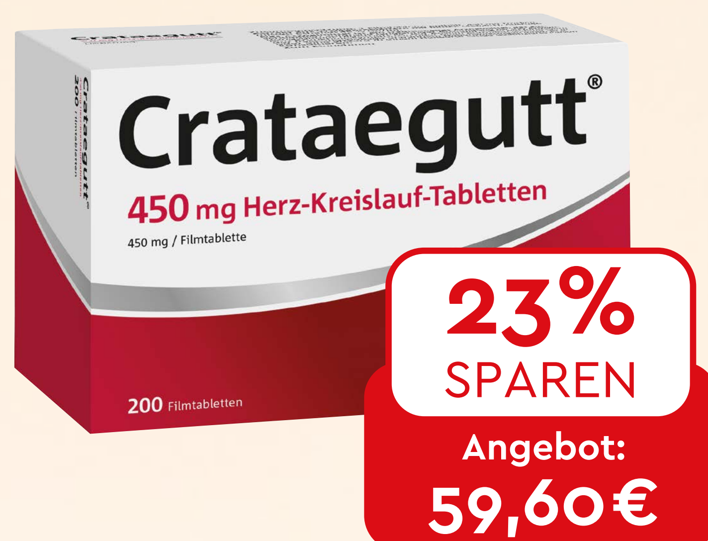
Crataegutt 450 mg