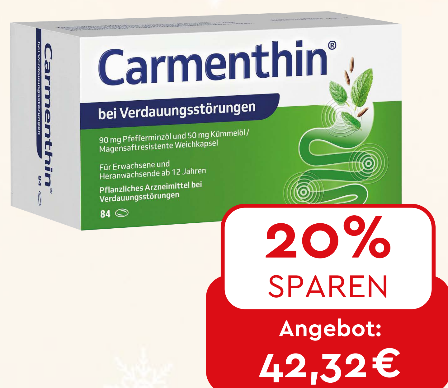
Carmenthin bei Verdauungsstörungen