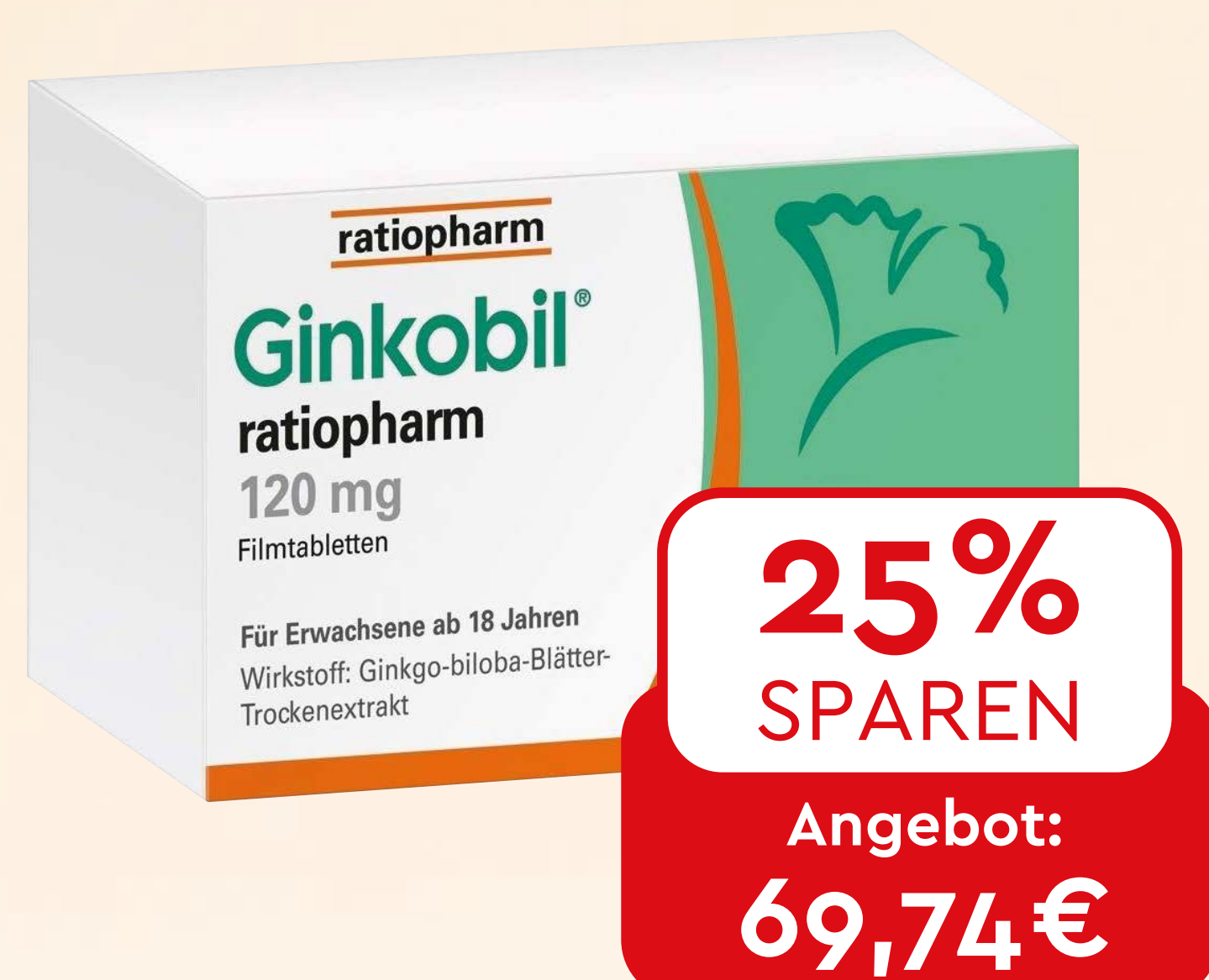
Ginkobil ratiopharm 120 mg