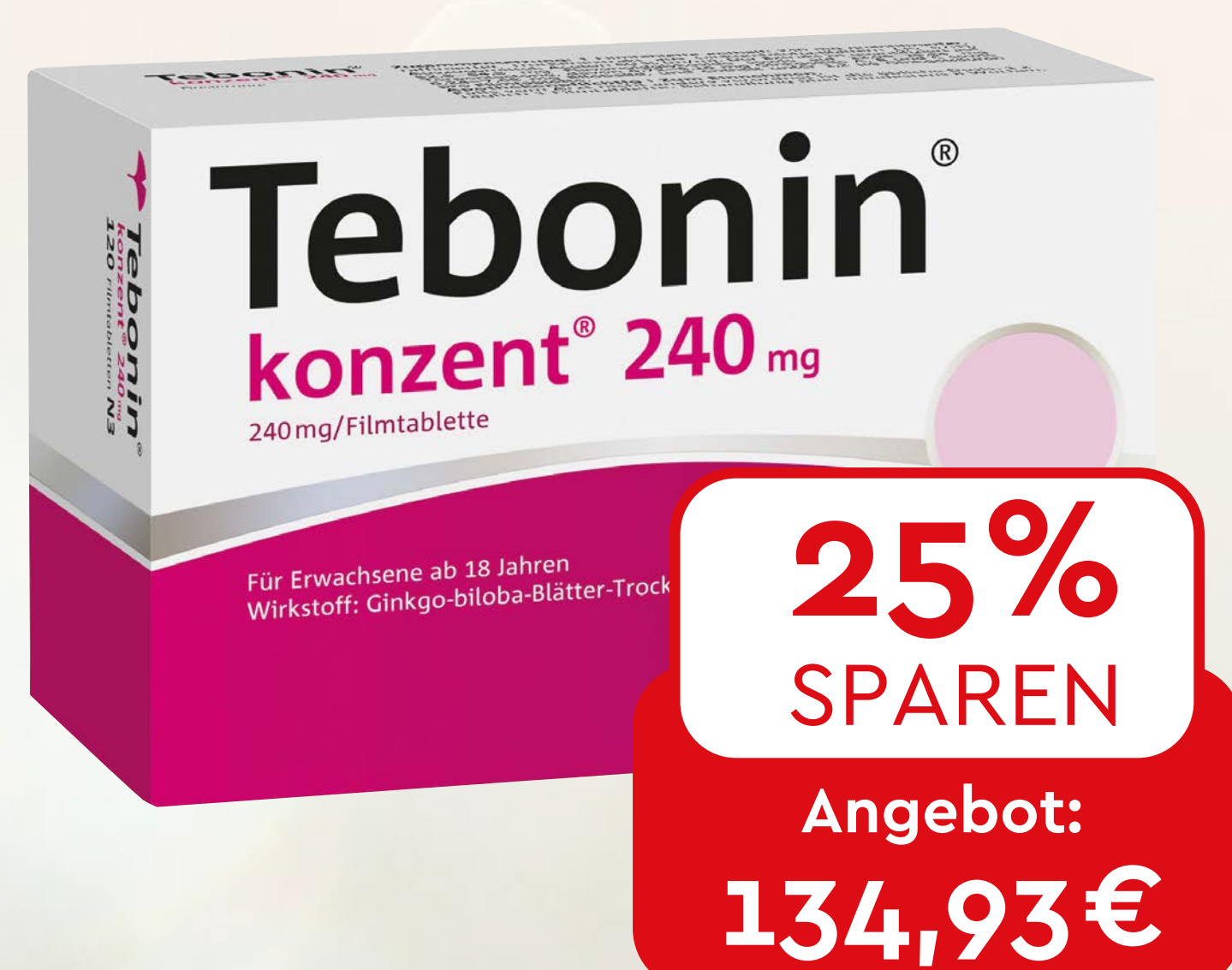
Tebonin konzent 240 mg